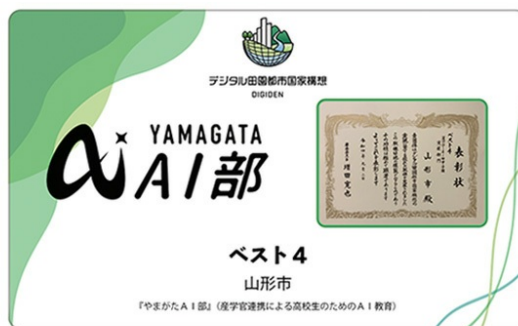
副賞のNFTデザイン(夏のDigi田甲子園時のデータ)